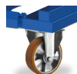
Roues 150, 160 ou 200mm Polyamide ou Polyuréthane 2 fixes et 2 pivotantes avec frein