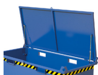
Couvercle en acier avec vérins hydrauliques